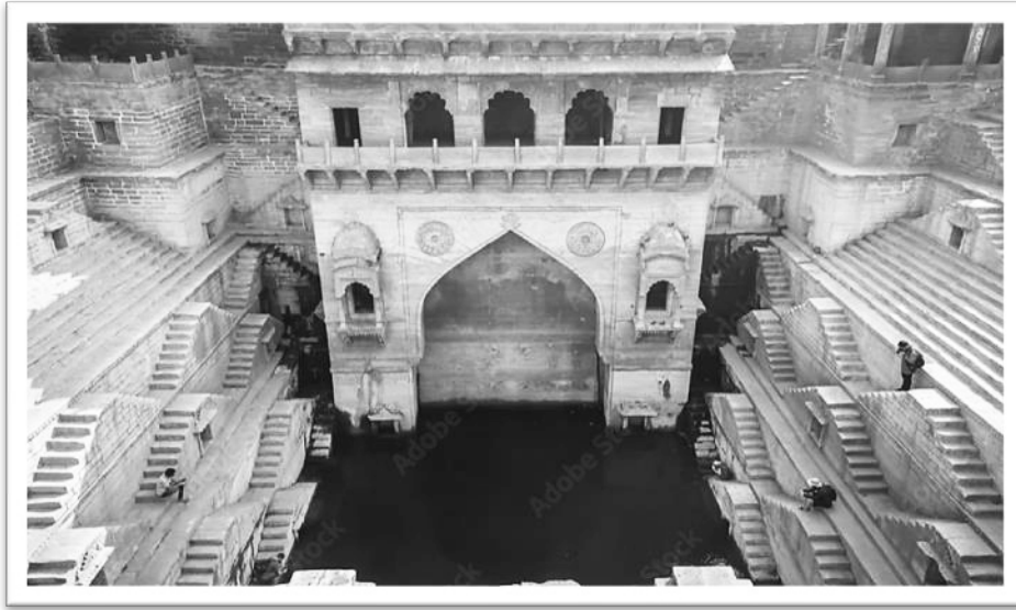
चित्र 1: स्थापत्य एवं पारंपरिक जल प्रबंधन प्रणाली की उत्कृष्टता को प्रदर्शित करता तूरजी का झालरा

तूरजी का झालरा, 18वीं सदी के जोधपुर शहर की स्थापत्य एवं पारंपरिक जल प्रबंधन प्रणाली की उत्कृष्टता का प्रतीक है। इसे जोधपुर के महाराजा अभय सिंह राठौड़ के शासनकाल के दौरान उनकी महारानी तंवर (तूर रानी) ने वर्ष 1740 में बनवाया था, जिसके कारण इसका नाम तूरजी/तोरजी का झालरा पड़ा। इसे 'तूरजी की बावड़ी' भी कहा जाता है। यह झालरा मरुस्थलीय शहर में लोगों के लिए महत्वपूर्ण जल स्रोत होने के साथ-साथ जल संरक्षण की विशेष तकनीक को भी प्रकट करता है, जो उस समय की सामुदायिक सहभागिता, उपयोगिता और अद्वितीय शिल्पकला के अनूठे संगम को प्रदर्शित करता है।