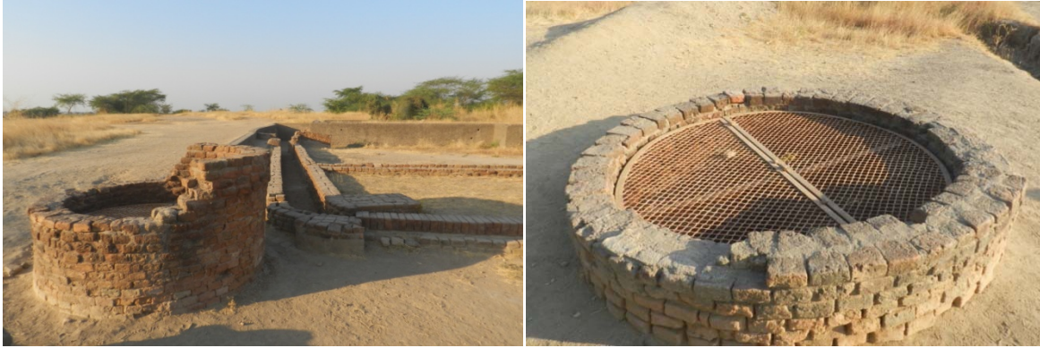
चित्र 6.1: लोथल में खोजे गए 2600 ई.पू. के कुएं

एशिया के शुष्क और अर्ध शुष्क क्षेत्रों में, जहां मनुष्य की गतिविधियों को जल की उपस्थिति नियंत्रित करती थी, वहां पर प्राचीन काल से ही भूजल का विकास और उपयोग बहुत महत्वपूर्ण रहा है। इतिहास के प्रारंभ से हाल के समय तक, झरनों और नालों के जल स्रोतों ने विवाद पैदा किया है तथा यह एक बहुत अधिक अटकलों और विवादों का विषय रहा है। मोहनजो-दारो कांस्य युग (लगभग 2450 ईसा पूर्व) के दौरान सिंधु सभ्यता का एक प्रमुख शहरी केंद्र था। हाल ही में, एंजेलकिस और झोंग (2015) ने पाया कि शहर को कम से कम 700 कुओं से जल मिल रहा था। इन कुओं का आकार गोलाकार से लेकर पीपल के पत्ते के आकार का था (खान, 2014)। हड़प्पा के प्रमुख स्थल लोथल में (लगभग 2600 ईसा पूर्व निर्मित) खोजे गए कुओं को चित्र 6.1 में दर्शाया गया है।