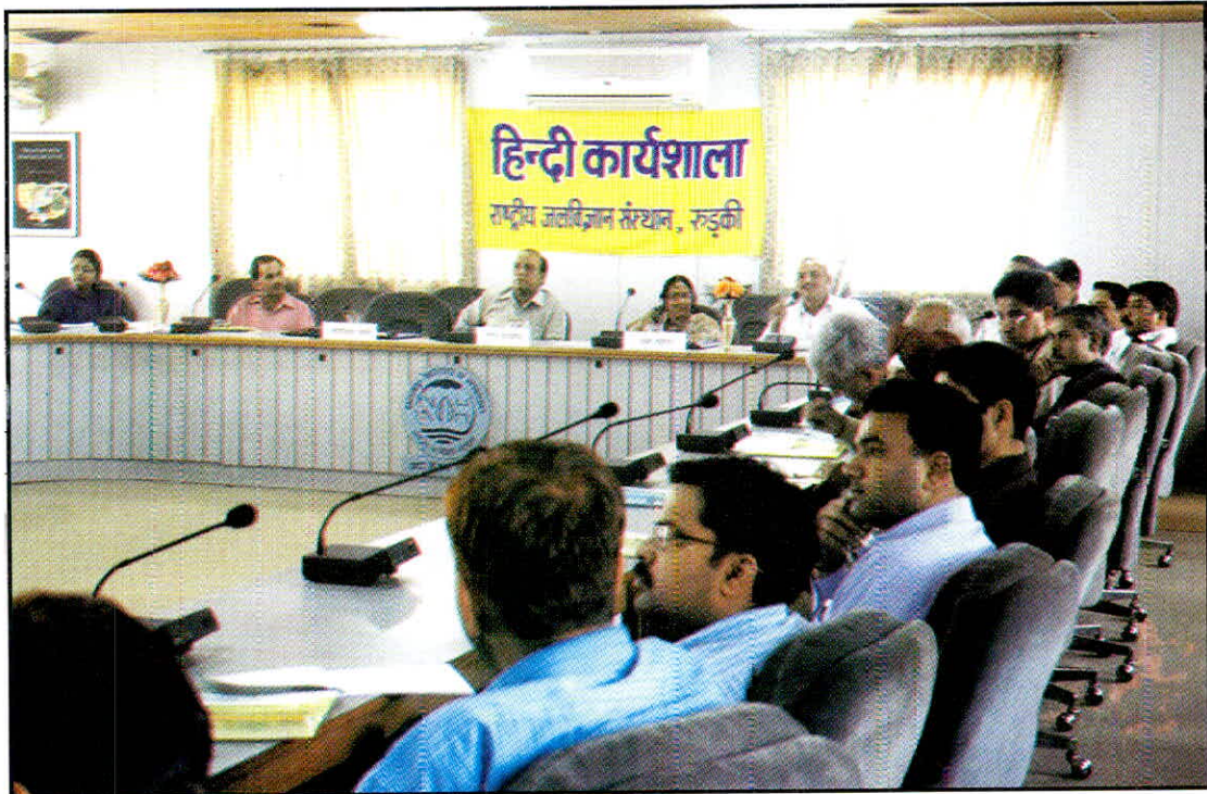
12 मार्च, 2010 को 'हिन्दी सॉफ्टवेयर-यूनीकोड एवं राजभाषा कार्यान्वयन' पर आयोजित हिन्दी कार्यशाला का एक दृश्य।