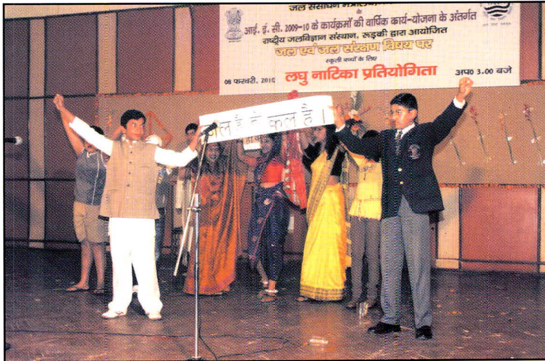
08 फरवरी, 2010 को स्कूली बच्चों के लिए 'जल संरक्षण' संबंधी विभिन्न विषय वस्तुओं पर आयोजित 'लघु नाटिका प्रतियोगिता' में प्रस्तुति देते स्कूली छात्र-छात्राएं।