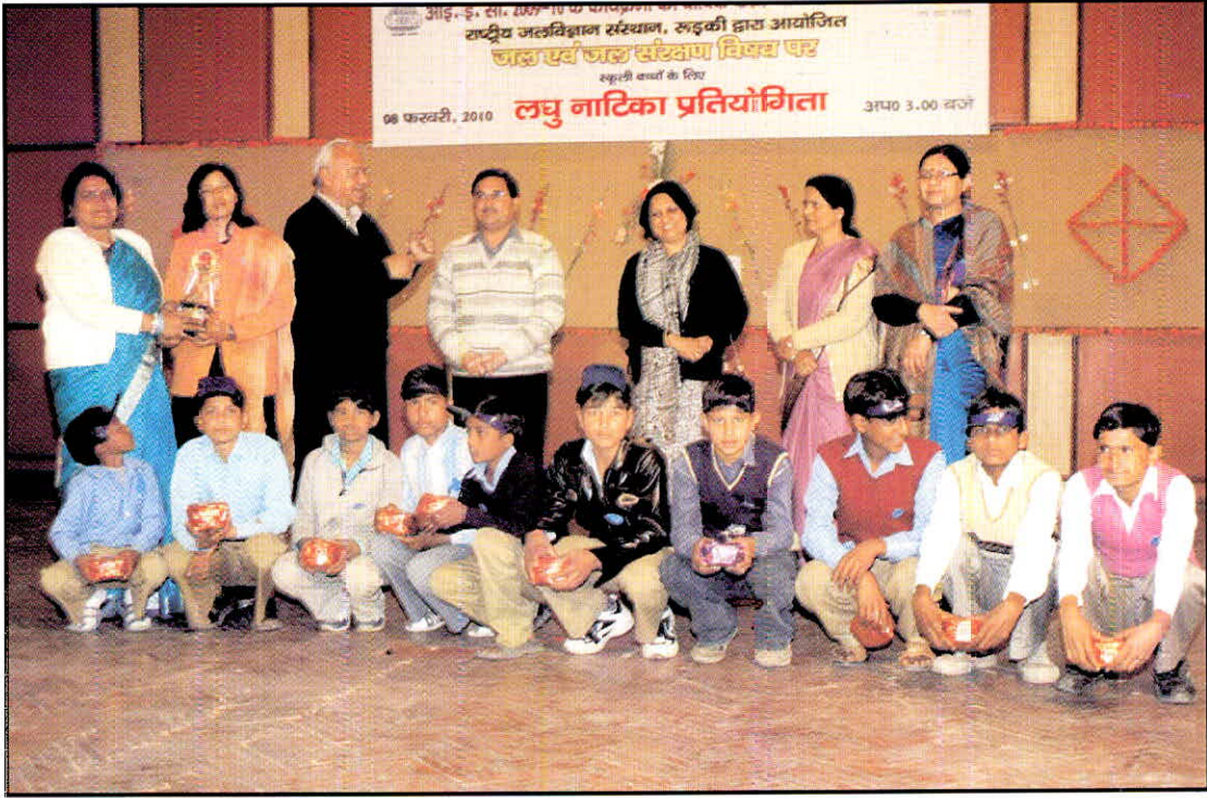
08 फरवरी, 2010 को स्कूली बच्चों के लिए 'जल संरक्षण' संबंधी विभिन्न विषय-वस्तुओं पर आयोजित 'लघु नाटिका प्रतियोगिता' में विजेता बच्चों के साथ निर्णायक मंडल के सदस्य।