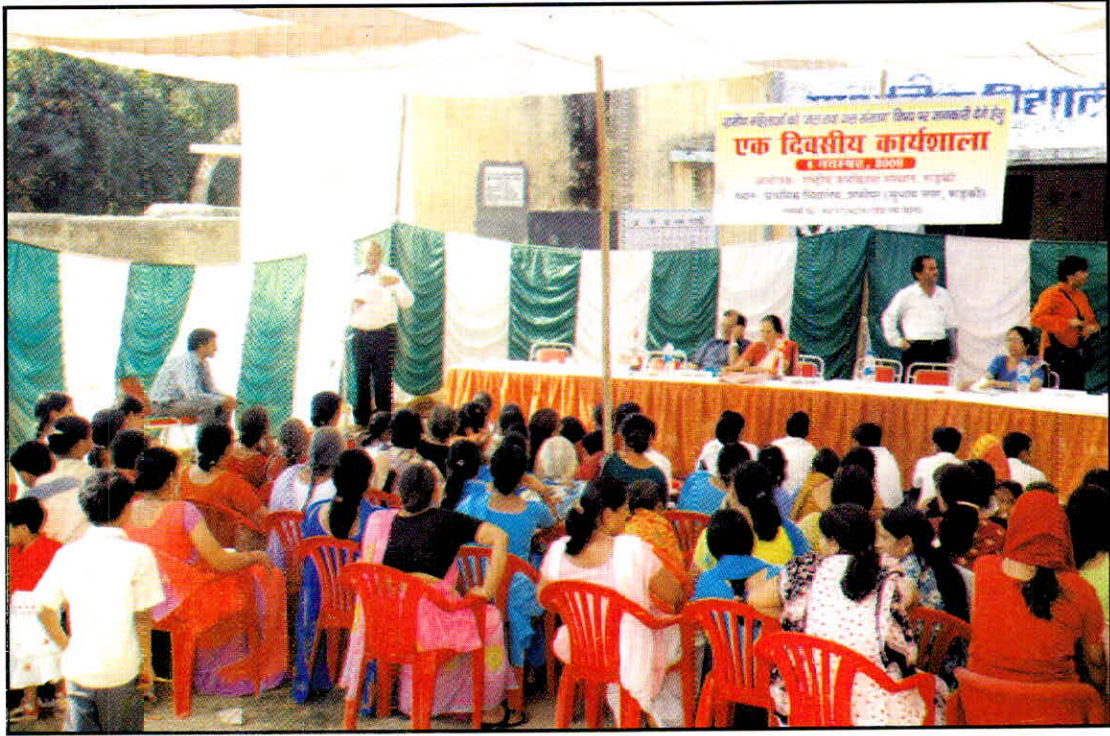
06 नवम्बर, 2009 को ग्रामीण महिलाओं के लिए जल एवं जल संरक्षण संबंधी जानकारी देने हेतु प्राथमिक विद्यालय, शफीपुर (रुड़की) में आयोजित कार्यशाला का एक दृश्य।