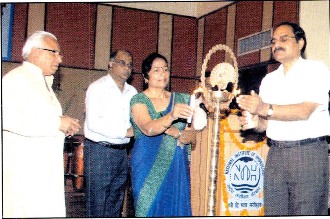
हिन्दी सप्ताह-2009 के उदघाटन समारोह में मुख्य अतिथि तथा निदेशक राजसं अन्य मंचासीन व्यक्तियों के साथ दीप प्रज्वलित करते हुए।