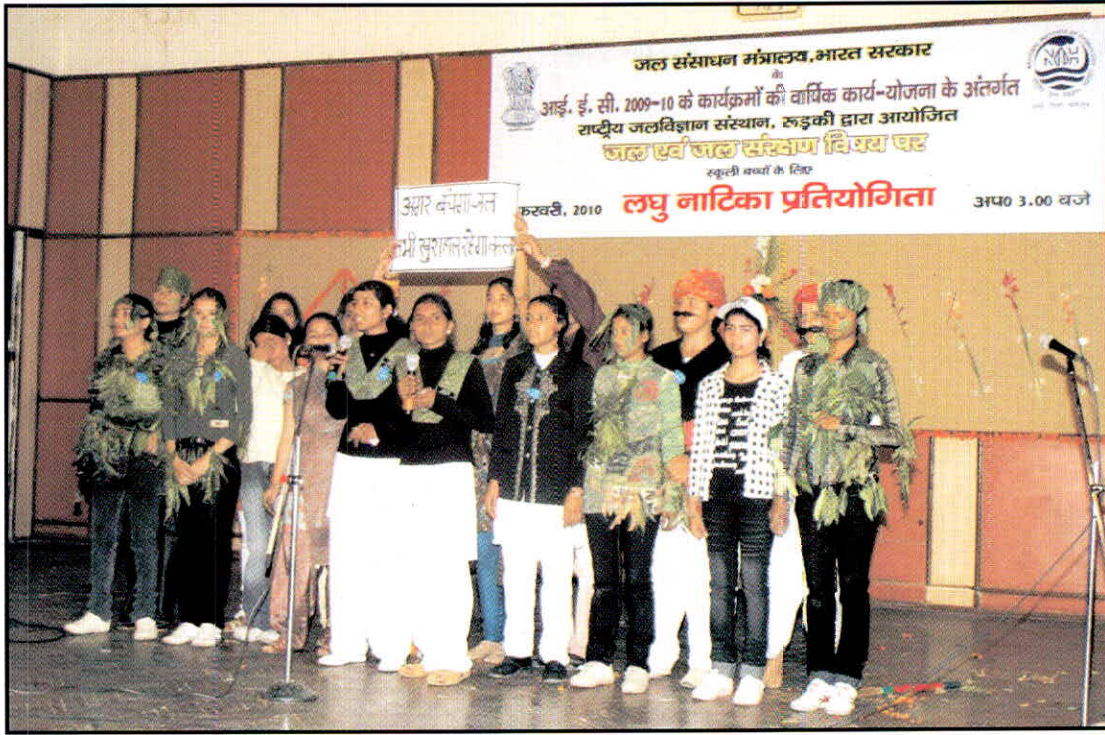
08 फरवरी, 2010 को स्कूली बच्चों के लिए 'जल संरक्षण' संबंधी विभिन्न विषय वस्तुओं पर आयोजित 'लघु नाटिका प्रतियोगिता' में प्रस्तुति देते स्कूली छात्र-छात्राएं।