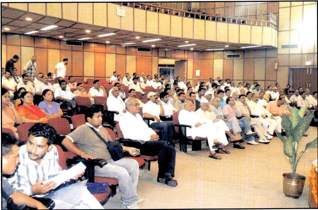
हिन्दी सप्ताह-2009 के उदघाटन समारोह का एक दृश्य।