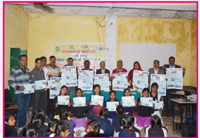
जल संरक्षण पर जागरूकता कार्यक्रम।

IIWQ वैज्ञानिक अनुसंधान, ज्ञान-साझाकरण, नवीन तकनीकों, उपकरणों और नीतिगत दृष्टिकोण को जल के गुणवत्ता सम्बंधित विषयों (जल प्रदूषण, जल गुणवत्ता निगरानी, जल का पुनः उपयोग, जलवायु परिवर्तन के प्रभाव, आदि) को संबोधित करने के लिए बढ़ावा देता है। IIWQ क्षमता निर्माण के साथ ही जल की गुणवत्ता और अपशिष्ट जल के बारे में एक समग्र और बहु-विषयक (Multi-disciplinary) दृष्टिकोण का उपयोग करते हुए