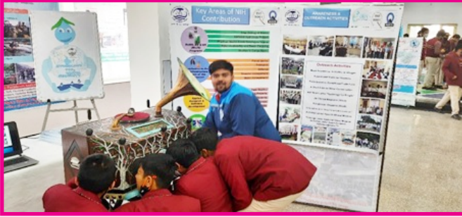
जल पर आयोजित प्रदर्शनी में राष्ट्रीय जलविज्ञान संस्थान की भागीदारी।