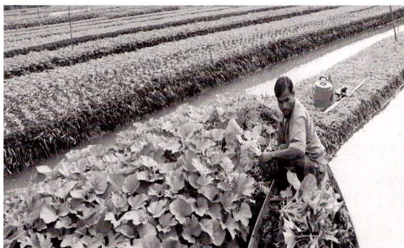
चित्र 4 : बिक्री के लिए पौध इकट्ठा करता किसान

तैरती कृषि, किसानों की आजीविका के विकल्प, सीमित संसाधनों के साथ खाद्य व पोषण सुरक्षा सुनिश्चित करने, बाढ़ के प्रभाव को कम करने, और पर्यावरण अनुकूलित निश्चित जलवायु-स्मार्ट कृषि तकनीक के रूप में लोकप्रिय हो रही है। यह आय पूरक तकनीक, विकासशील देशों में मौजूद आर्द्रभूमियों को कृषि योग्य बनाने में उपयुक्त है। उचित प्रबंधन के साथ यह तकनीक, ग्रामीण अर्थव्यवस्था को पुनर्जीवित करने में योगदान दे सकती है। तैरती कृषि इस बात का उदाहरण है कि, कैसे एक सदियों पुराना “प्राकृतिक-संसाधन-आधारित समाधान”, जलवायु परिवर्तन, खाद्य सुरक्षा और आर्थिक विकास जैसी सामाजिक चुनौतियों से लड़ने के लिए नए आयाम प्रदान कर सकता है। इस तकनीक की स्थायी व सकारात्मक विशेषताओं के कारण बांग्लादेश जैसे विकासशील देशों में इसकी व्यापकता बढ़ रही है। तैरती कृषि, केवल बांग्लादेश के लिए ही उपयुक्त नहीं है, बल्कि इसका उपयोग म्यांमार, कंबोडिया और भारत में भी किया जा रहा है। यह पारंपरिक तकनीक अन्य क्षेत्रों में संभावित रूप से हस्तांतरणीय है, जो वर्तमान में अप्रत्याशित जलवायु परिवर्तन का सामना कर रहे हैं। भारत में बड़ी संख्या में तालाब, झीलें, नदियाँ और मौसमी बाढ़ के मैदान, जलीय कृषि के लिए प्रचुर अवसर पैदा करते हैं। सरकारी समर्थन से यह स्थायी कृषि पद्धति, भविष्य में खाद्य उत्पादन जारी रखने एवं भोजन स्थिरता प्रदान करने की एकमात्र कुंजी हो सकती है, क्योंकि बाढ़ व सूखा दोनों अधिक गंभीर होते जा रहे हैं। क्योंकि प्रतिकूल परिस्थितियों में भी इसकी उत्पादकता संतोषप्रद है, अतः तैरती कृषि तकनीक को बड़े पैमाने पर बढ़ावा देना आवश्यक है।