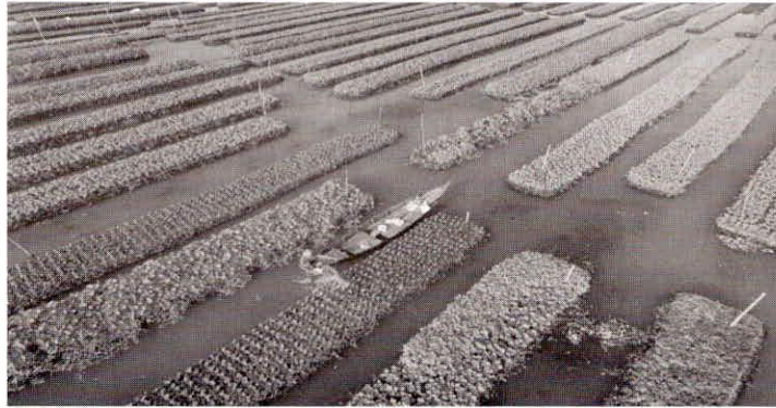
आकृति 3 : तैरती क्यारी की सिंचाई करता किसान