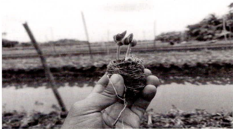
चित्र 2 : अंकुरित बीज की गेंद (टेमा)