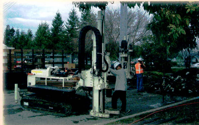
पानी के अंधाधुंध दोहन से भूजल में गिरावट आ रही है