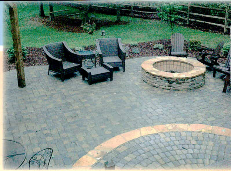
मैनिट ब्लॉक पानी का रिसाव करने में अधिक कारगर होता है

इसलिए भी पहले से अधिक होने लगी है कि किसान परम्परागत खेती के स्थान पर आधुनिक खेती को अपना रहे हैं। आधुनिक पद्धति में पानी अधिक लगता है।