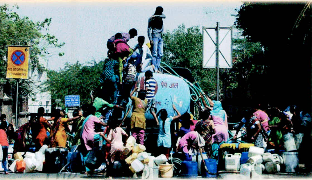
स्वच्छ पेयजल के लिए संघर्ष करते लोग

पानी को संग्रहित करने के लिए बांध बनाए जाते हैं लेकिन इसमें कुल उपलब्ध पानी का मात्र 20 प्रतिशत ही संग्रहित हो पाता है। हालांकि आजादी के बाद देश में छोटे-बड़े बांधों की संख्या में वृद्धि हुई है, तो भी ये अपर्याप्त हैं। 1947 के पूर्व देश में बांधों की संख्या मात्र 300 थी, जो वर्तमान में 4500 के करीब हो गई है।