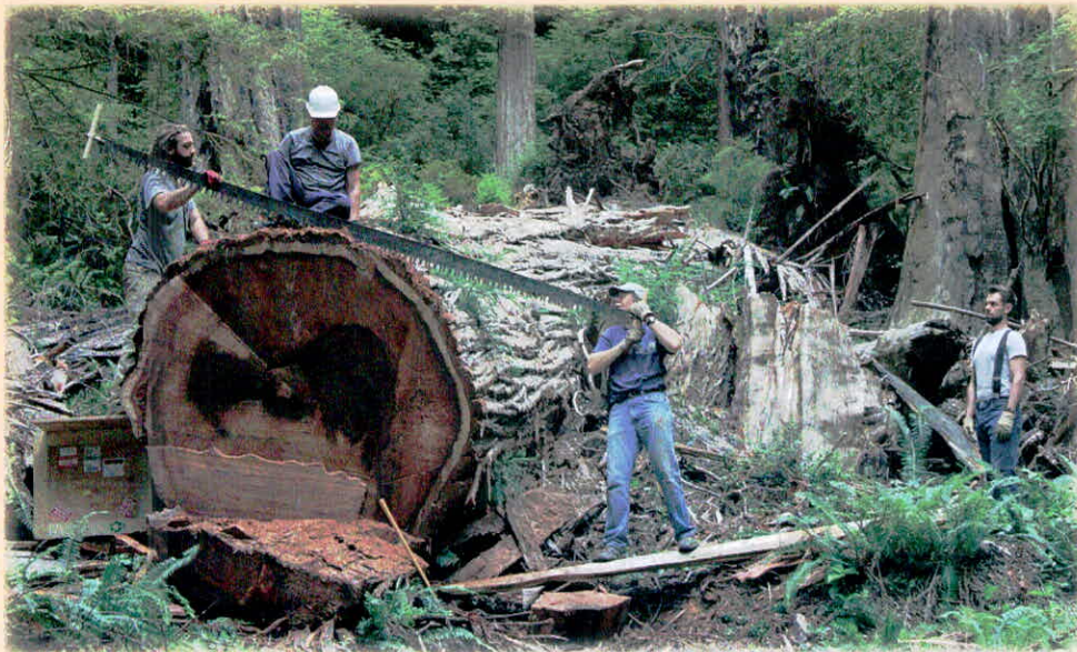
वनों की अंधाधुंध कटाई से वर्षा की स्थिति प्रभावित होती है

भी शेष नहीं रहेगा। इसलिए भूमिगत जलसंरक्षण के प्रति अभी से ध्यान देना होगा।