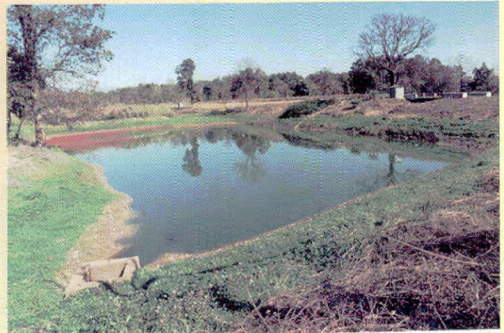
पहले गाँवों, कस्बों और नगरों की सीमा पर या कहीं नीची सतह पर तालाब अवश्य होते थे, जिनमें स्वाभाविक रूप में मानसून की वर्षा का जल एकत्रित हो जाता था।

3. पहले गाँवों, कस्बों और नगरों की सीमा पर या कहीं नीची सतह पर तालाब अवश्य होते थे, जिनमें स्वाभाविक रूप में मानसून की वर्षा का जल एकत्रित हो जाता था। साथ ही, अनुपयोगी जल भी तालाब में जाता था, जिसे मछलियाँ और मेंढक आदि साफ करते रहते थे और तालाबों का जल पूरे गाँव के पीने, नहाने और पशुओं आदि के काम में आता था। दुर्भाग्य यह कि स्वार्थी मनुष्य ने तालाबों को पाट कर घर बना लिए और जल की आपूर्ति खुद ही बन्द कर बैठा है। जरूरी है कि गाँवों, कस्बों और नगरों में छोटे-बड़े तालाब बनाकर वर्षाजल का संरक्षण किया जाए। 4. नगरों और महानगरों में घरों