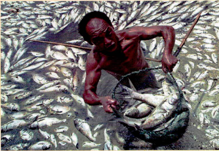
“अवतार-परंपरा” के अनुसार प्रथम अवतार के रूप में “मत्स्यावतार” होता है। मत्स्य अर्थात् मछली के रूप में “ब्रह्म” अवतार लेकर सृष्टि का शुभारंभ करते हैं।