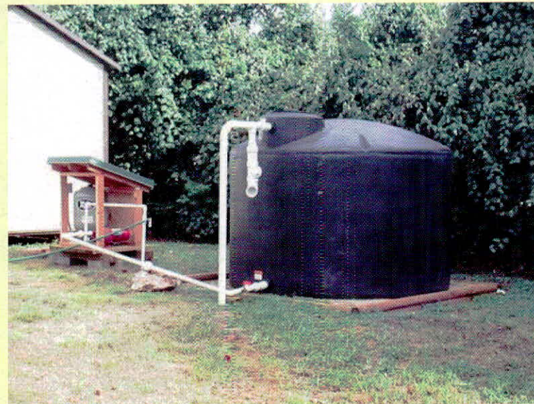
अगर प्रत्येक घर की छत पर "वर्षाजल" का मंडार करने के लिए एक या दो टंकी बनाई जाएं और इन्हें मजबूत जाली या फिल्टर कपड़े से ढक दिया जाए तो हर घर में "जल-संरक्षण" किया जा सकेगा।

की नालियों के पानी को गड़ढे बना कर एकत्र किया जाए और उसे पेड़-पौधों की सिंचाई के काम में लिया जाए, तो साफ पेयजल की बचत अवश्य होगी। 5. अगर प्रत्येक घर की छत पर "वर्षाजल" का मंडार करने के लिए एक या दो टंकी बनाई जाएं और इन्हें मजबूत जाली या फिल्टर कपड़े से ढक दिया जाए तो हर घर में "जल-संरक्षण" किया जा सकेगा। 6. घरों, मुहल्लों और सार्वजनिक पार्कों, स्कूलों अस्पतालों, दुकानों,