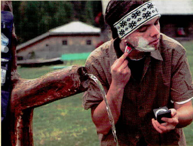
“जल की बरबादी” वास्तव में हमारे पूरे समाज के विकास की बरबादी है।

विश्व में जल वैज्ञानिकों की सबसे बड़ी चिन्ता “जल-संरक्षण” की ही है। जल-संरक्षण केवल सरकारी घोषणाओं अथवा योजनाओं का ढोल पीटने से नहीं होगा, बल्कि पूरे विश्व में जोर-शोर से जन-जागरण-अभियान चला कर हमें प्रत्येक मनुष्य को “जल-संरक्षण-अभियान” से जोड़ना होगा तथा निम्न “जल-स्तुति” की पंक्तियाँ घर-घर पहुँचानी होंगी—