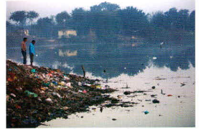
देश की नदियों का 70 प्रतिशत पानी प्रदूषित है

पीड़ित होते हैं। इनमें से 10 प्रतिशत बच्चों में पानी के टोटे के कारण शरीर ँठता है। इसी प्रकार गंदलाते पानी की देन डेंगू भी हर साल राजधानी तक को रुला देती है।