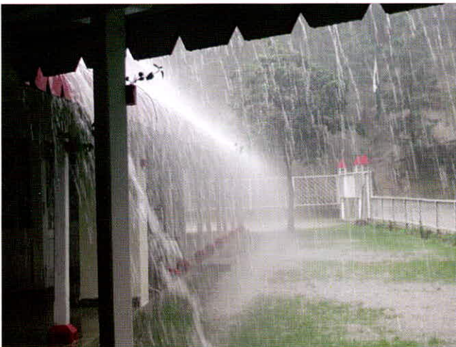
विश्व बैंक की एक रिपोर्ट के अनुसार विकासशील देशों में पानी की भारी किल्लत है

विश्व बैंक की एक रिपोर्ट के अनुसार विकासशील देशों में पानी की भारी किल्लत है। यहां आज भी व्यक्ति पानी की न्यूनतम आवश्यकता को पूरी करने में सफल नहीं हो पाता। ज्यों-ज्यों आबादी बढ़ती गई मानव रहने के लिए आवास की तलाश में दूर-दूर तक पहुंचने लगा। इस तरह से पानी के प्रमुख स्रोत नदियाँ दूर छूट गईं और पनघट की लंबी यात्रा शुरू हो गई। अब चाहे शहर के मुहल्ले के नुक्कड़ का नल हो या गांव का दूर-दराज का कुआं या नदी, शुरू से ही पानी लाने का जिम्मा संभाला महिलाओं ने। घर में पानी की जरूरत पूरी करने के लिए मटके-दर-मटके धरे लंबी यात्रा तय की जाने लगी। आज अंतर्राष्ट्रीय स्तर पर यह बात तय हो चुकी है कि पानी की