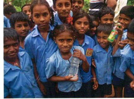
विकासशील देशों में 80 प्रतिशत रोग पानी के संक्रमण से ही पैदा होते हैं

पानी से उत्पन्न रोगों में डायरिया वर्ग के रोग काफी भीषण हैं। दिल्ली जैसे महानगर में भी हर साल (खासकर बरसात के दिनों में) पानी से फैलने वाले रोगों का खतरा बना रहता है। देश-भर में डायरिया को लेकर हुए अध्ययन बताते हैं कि पांच साल से कम उम्र के ज्यादातर बच्चे डायरिया से