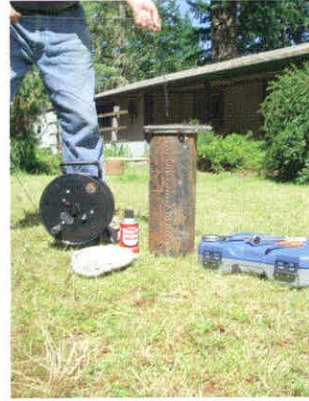
देश में विभिन्न उद्योगों में साफ पानी की खपत लगभग 600 करोड़ घन मीटर है

कुल मिलाकर देश में पानी का एक बड़ा हिस्सा गंदला रहा