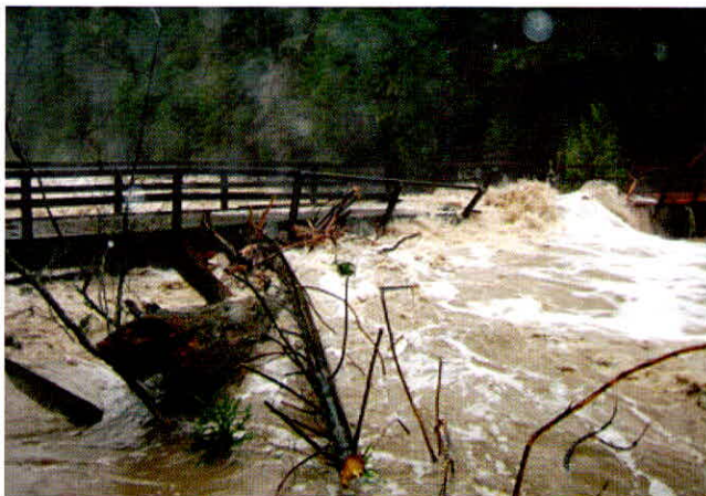
नदियां तो आज भी लहरा रही हैं मगर उनका रूप बदला हुआ है

हमारे देश में पानी की समस्या बाकी विकासशील देशों की तुलना में ज्यादा नाजुक है। देश की भौगोलिक हालत का जायजा लीजिए तो यह नदियों वाला देश है। भारतीय सभ्यता का विकास ही नदियों के किनारे हुआ। इन नदियों में बहुत कम ऐसी नदियां हैं जो किसी और में समाहित हो अपना नाम खो गईं मगर नदियां अभी भी हैं। सवाल उठता है कि नदी-नालों वाले इस देश में फिर पानी का टोटा क्यों है? असल में नदियां तो आज भी लहरा रही हैं मगर उनका रूप बदला हुआ है। एक जमाना था जब नदी किनारे नहाने और "पावन जल" का आचमन करने का अलग ही मजा था। मगर अब ये नदियां मल-विसर्जन और औद्योगिक कचरे के बोझ से अटी पड़ी हैं।