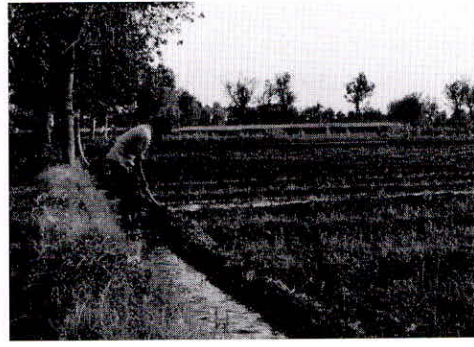
चित्र क्रमांक 1. : भारतीय पारंपरिक पूर्ण जल भराव सिंचाई प्रणाली और छोटी नहर एवं क्यारी सिंचाई प्रणाली