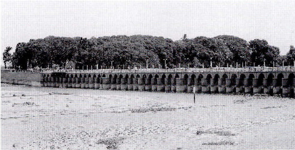
चित्र क्रमांक 3. : कावेरी नदी पर चोल शासकों द्वारा निर्मित एक बड़ा अनीकट (कल्लनई)

मध्यकालीन भारतीय इतिहास में, ग्यारहवीं शताब्दी में, भोपाल के शासक राजा भोज द्वारा एक विशाल झील के निर्माण का उल्लेख मिलता है। कल्हण की रचना, रजत-रंगनी में भी कश्मीर के आस-पास डल झील के माध्यम से एक व्यवस्थित सिंचाई प्रणाली का उल्लेख मिलता है। फिरोजशाह तुगलक (1351-86) द्वारा बनवाई गयी नहर भी सिंचाई विकास के क्रम में आती है। विभिन्न सियासतों के राजा-महाराजाओं द्वारा अपने शासन काल में झीलों, जलाशयों, बाँधों, आदि का बड़े पैमाने पर निर्माण कराया गया जो आज भी भारतीय सिंचाई के रूप में विद्यमान हैं।