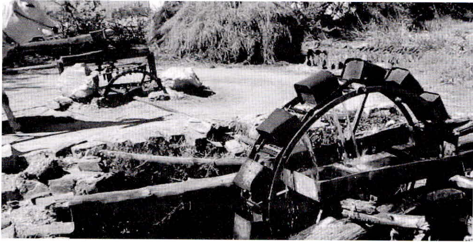
चित्र क्रमांक 2. : बैल/ऊँट से खिंची जाने वाली रेहट/चरस द्वारा कुएँ से की जाने वाली सिंचाई प्रणाली

भारतीय अर्थव्यवस्था में कृषि महत्वपूर्ण स्थान रखता है, जिसका सकल विकास उत्पाद (GDP) में योगदान 14.1% (2014-15) है। कृषि हमारे देश की 65-70% आबादी के लिए जीविकोपार्जन का एक मात्र साधन है। इस दृष्टिकोण से कृषि केवल एक उद्योग नहीं है अपितु अर्थव्यवस्था की रीढ़ की हड्डी है। उल्लेखनीय है कि वर्ष 2014-15 में कुल खाद्यान्न उत्पादन 259.2 मिलियन टन प्राप्त हुआ जो अब तक का रिकार्ड है। जहाँ एक ओर संपूर्ण विश्व में खाद्य सुरक्षा की बात उठाई जा रही है वहीं भारत में रिकार्ड खाद्यान्न उत्पादन हो रहा है। विश्व खाद्य सुरक्षा एक चिंतनीय विषय है और ऐसी परिस्थितियों में कृषि क्षेत्र को वरीयता दिये जाने की आवश्यकता है। भारतीय कृषि के पिछड़ेपन और कृषकों की निर्धनता के मूल कारण हैं : 1) भारतीय कृषि की मानसून पर निर्भरता और 2) उन्नत सिंचाई प्रणालियों का सीमित उपयोग।