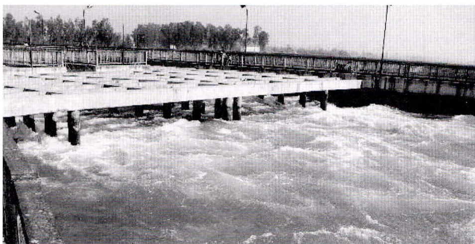
चित्र क्रमांक 4. : रुड़की शहर के समीप से बहती ऊपरी गंगा-नहर का दृश्य